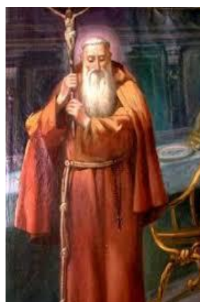
BŁ. JÓZEF DYDAK Z KADYKSU, prezbiter

Józef Lopez Caamano urodził się w 1743 r. w Kadyksie (Hiszpania). Wstąpił do zakonu kapucynów w Sewilii, gdzie otrzymał imię Dydak. Po ukończeniu studiów filozoficzno-teologicznych przyjął święcenia kapłańskie. Wkrótce objawił się w nim niezwykły, Boży dar głoszenia. Przemierzał całą Hiszpanię, niosąc orędzie Ewangelii do najbardziej oddalonych nawet wiosek i miasteczek. Jego język był prosty i zrozumiały dla każdego. Wszyscy jego słuchacze byli pod wrażeniem kazań, które odciskały wyraźne piętno na ich dalszym życiu. Odznaczał się niezwykłą czcią do tajemnicy Trójcy Świętej. Miał szczególną łaskę dotykania serc tych, którzy przychodzili do niego do konfesjonału. Odwiedzał szpitale i więzienia, angażował się w działalność dobroczynną. Na modlitwę poświęcał noce.